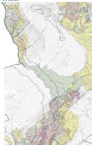
Figura 2 - Stralcio delle Tavole C3/3 e C3/2 “Carta della discipline delle aree e delle prescrizioni sovraordinate” del vigente Piano delle Regole del PGT di Alzano Lombardo

Rilevato, inoltre, che nella Tavola PS03 “Rete Ecologica Comunale” il PLIS Naturalserio è erroneamente indicato con la denominazione PLIS “Naturalserio e Piazze” 1 , si invita ad aggiornare in tutti gli elaborati di piano la denominazione corretta del PLIS.