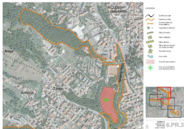
Figura 3 – Estratto planimetria 6.PR.3 dell'Ambito n.6 del Progetto Arco Verde

Sempre in tema di biodiversità, verificato che la Tavola PS03 riporta il corridoio ecologico del progetto Arco Verde e che l'art. 20 "Rete ecologica Comunale" delle NTA del Piano dei Servizi individua il suddetto progetto tra gli elementi costituenti la REC, si invita a recepirne le specifiche progettualità che interessano il territorio comunale, con particolare riferimento all'ambito primario n. 6 "Maresana – Fiume Serio" che interessa l'ambito di trasformazione AT1 (Figura 3) e all'ambito secondario F (Figura 4), di cui alcuni interventi sono già stati realizzati in località monte di Nese nell'ambito del successivo progetto F.A.R.E. Arco Verde (Figura 5)."