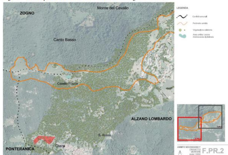
Figura 4 – Estratto planimetria F.PR.2 dell'Ambito F del Progetto Arco Verde